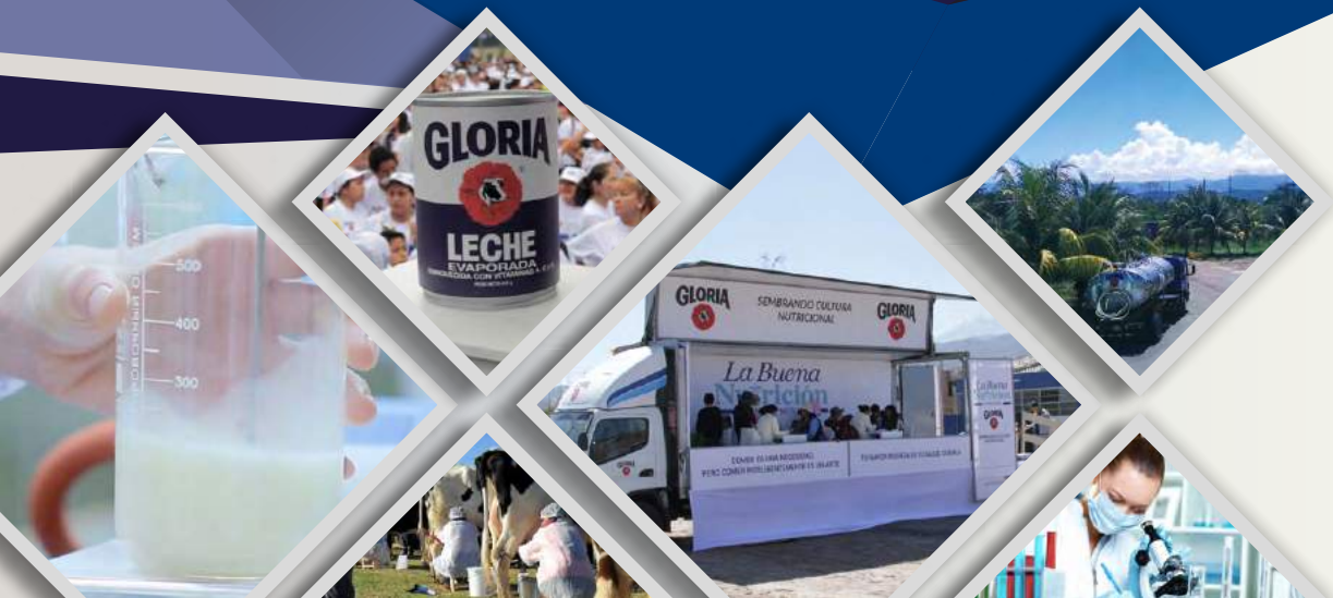
TABLA DE COMPOSICIÓN NUTRICIONAL DE PRODUCTOS LECHE GLORIA S.A.